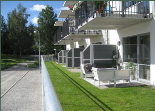
Skillevegg/Levegg - EKERUM & BORGHOLM