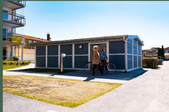
Miljøhus & Sykkelskur - HALLTORP & TRAMPAN